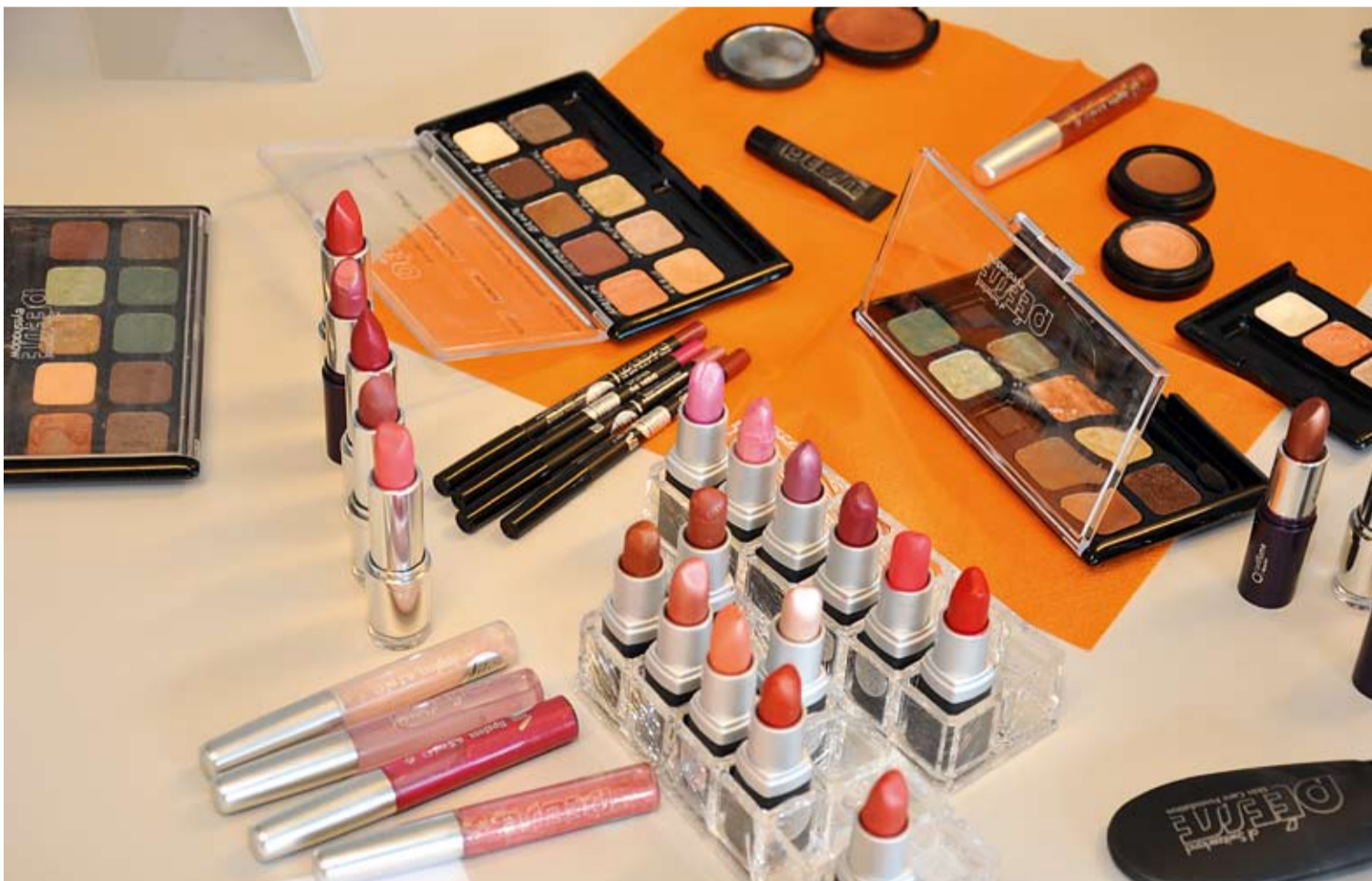
Abb. 1: Die Farbpalette bei Schminkprodukten ist riesig. Auf die richtige Auswahl kommt es an.

Zu einem schönen Make-up gehört natürlich auch Farbe für die Lippen.